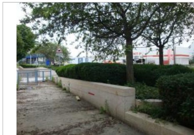
Vue de la laisse - SPC SMYL