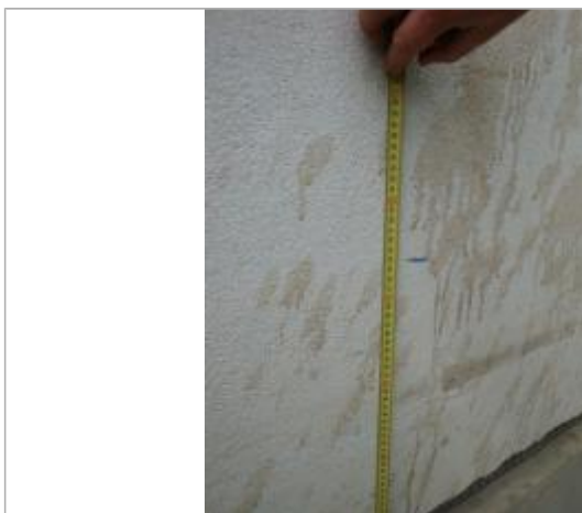
Vue de la laisse - SPC SMYL

Altitude calculée de l'eau (en m) : 32.479 m