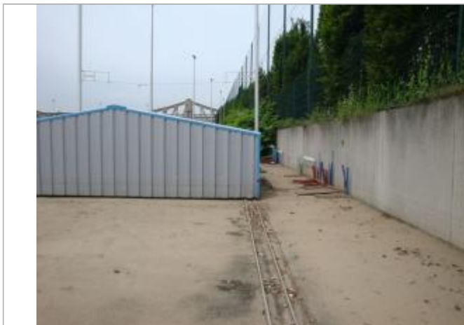
Vue de la laisse - SPC SMYL