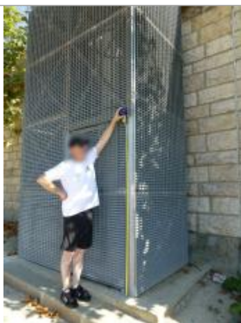
Vue de la laisse - SPC SMYL

Altitude calculée de l'eau (en m) : 32.27 m