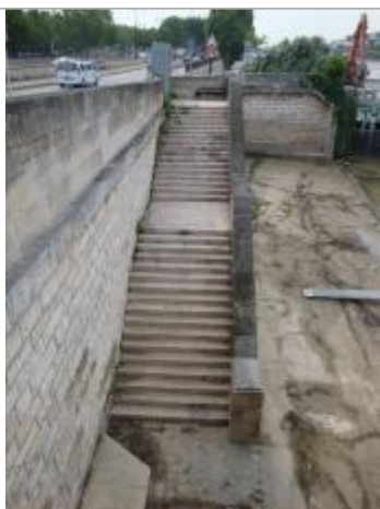
Vue de la laisse - SPC SMYL