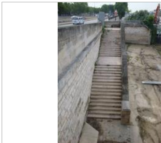
Vue du site - SPC SMYL