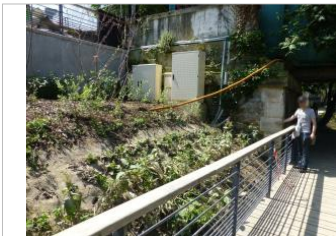
Vue de la laisse - SPC SMYL

Altitude calculée de l'eau (en m) : 29.745