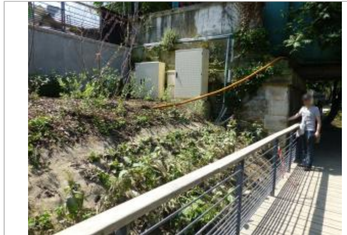
Vue du site - SPC SMYL