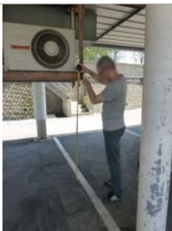
Vue de la laisse - SPC SMYL

Altitude calculée de l'eau (en m) : 29.154