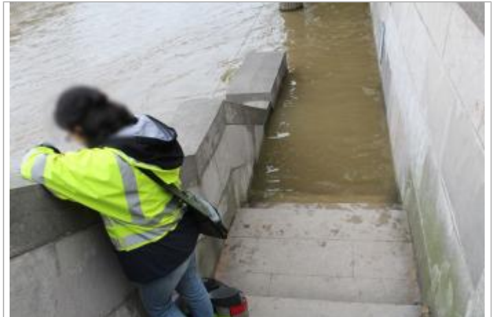
Vue du site - SPC SMYL