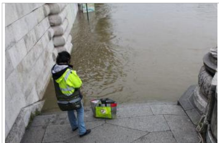
Vue de la laisse - SPC SMYL

Méthode : GPS Organisme : SPC Seine moyenne - Yonne - Loing Référence nivelée : Marque d'inondation Système altimétrique : NGF IGN 1969 (système normal) Altitude de la référence (en m) : 30.897 m Altitude calculée de l'eau (en m) : 30.897