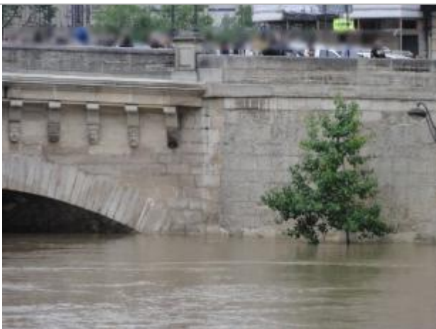
Vue de la laisse - SPC SMYL

Altitude calculée de l'eau (en m) : 31.177