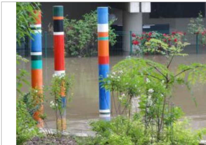
Vue de la laisse - SPC SMYL

Altitude calculée de l'eau (en m) : 31.838