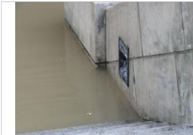
Vue de la laisse - SPC SMYL

Altitude calculée de l'eau (en m) : 31.963