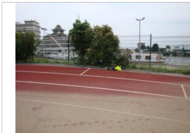
Vue de la laisse - SPC SMYL