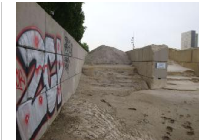
Vue du site - SPC SMYL

Coordonnées WGS84 : X: 2.37682770 / Y: 48.83739750