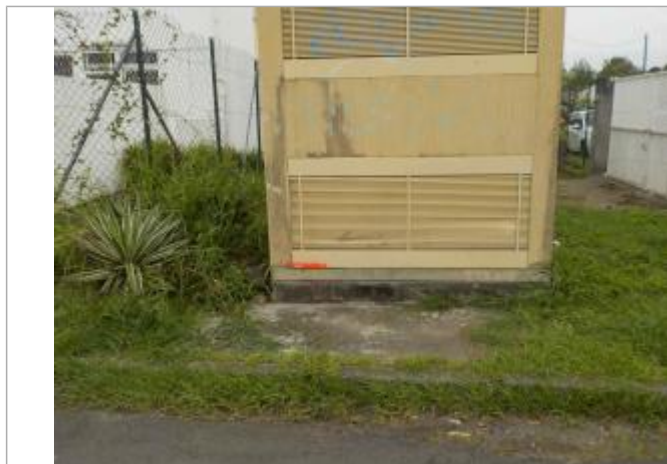
Vue de la PHE- Auteurs : DEAL, ONF et témoignages

Altitude calculée de l'eau (en m) : 2.02 m