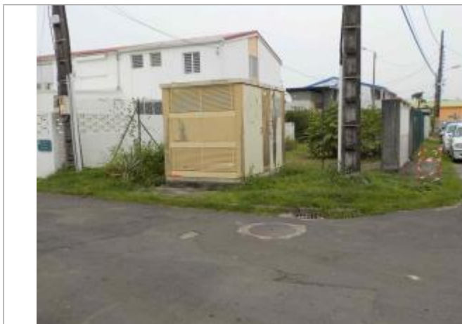
Vue du site- Auteurs : DEAL, ONF et témoignages

Coordonnées WGS84 : X: -61.52941700 / Y: 16.25907200