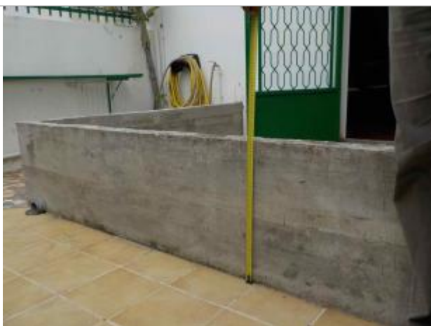
Vue de la PHE- Auteurs : DEAL, ONF et témoignages

Altitude calculée de l'eau (en m) : 2.526 m