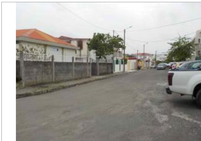
Vue du site- Auteurs : DEAL, ONF et témoignages

Coordonnées WGS84 : X: -61.53070700 / Y: 16.25738300