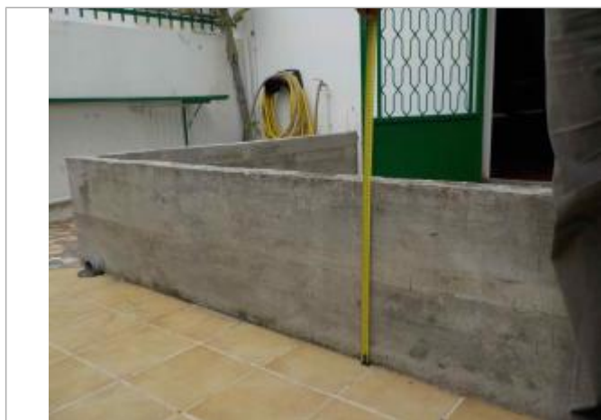
Vue de la PHE- Auteurs : DEAL, ONF et témoignages