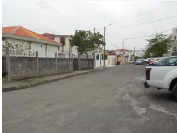
Vue du site- Auteurs : DEAL, ONF et témoignages