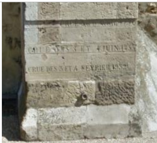
Vue du repère