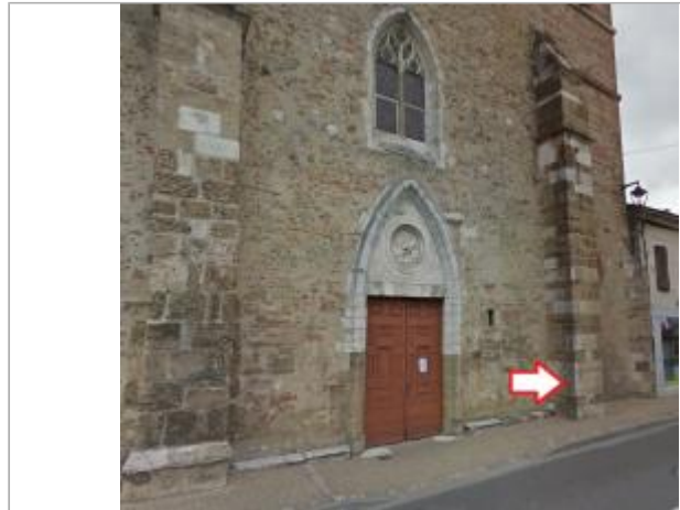
Vue du site - source : Google Street View (2016)