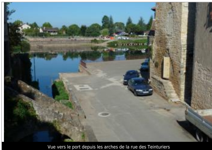
Vue vers le port depuis les arches de la rue des Teinturiers