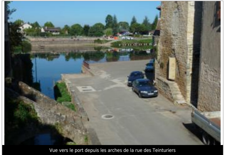
Vue vers le port depuis les arches de la rue des Teinturiers