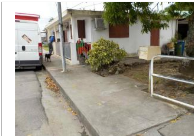
Vue du site- Auteurs : DEAL, ONF