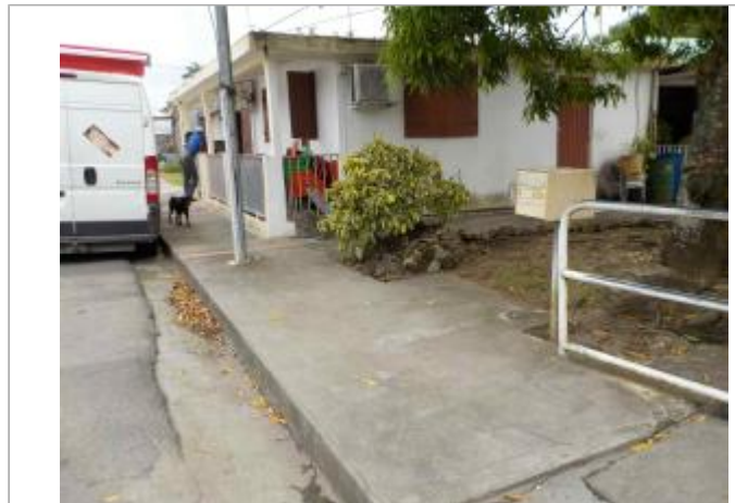
Vue du site- Auteurs : DEAL, ONF

Coordonnées WGS84 : X: -61.50883800 / Y: 16.33952300