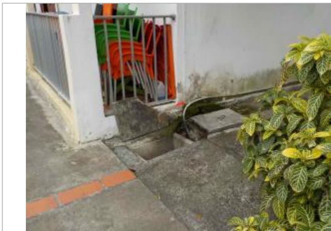
Vue de la PHE- Auteurs : DEAL, ONF