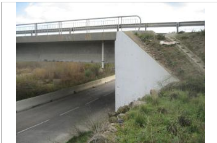
Vue du site - Auteur : CACG