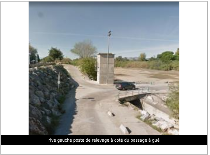
rive gauche poste de relevage à coté du passage à gué

GÉOLOCALISATION Coordonnées WGS84 : X: 2.87976560 / Y: 42.77327800 Coordonnées RGF93 (Lambert 93) X: 690148.83 / Y: 6185979.01 Coordonnées RGF93 (ETRS89) : X: 2.8797656 / Y: 42.773278