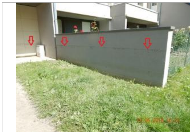
Dans l'entrée du 19 rue de la Cité des Prés Gâteaux

SOURCE DE REPÉRAGE : CAMPAGNE TERRAIN SPC SACN JUIN 2018 - 18/06/2018