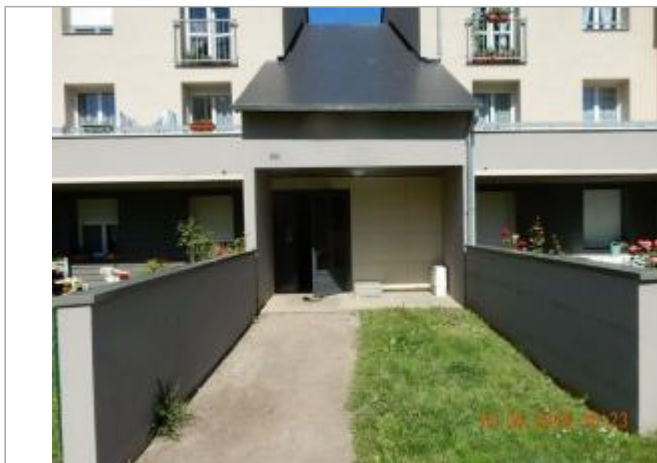
19 rue de la Cité des Prés Gâteaux