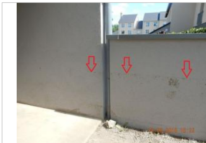
Dans l'entrée du 21 rue de la Cité des Prés Gâteaux

Altitude calculée de l'eau (en m) : 100.385