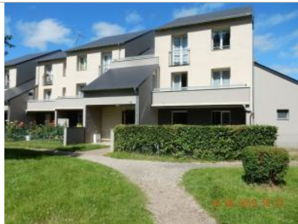
21 rue de la Cité des Prés Gâteaux