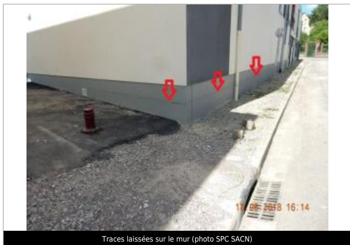
Traces laissées sur le mur

SOURCE DE REPÉRAGE : CAMPAGNE TERRAIN SPC SACN JUIN 2018 - 18/06/2018