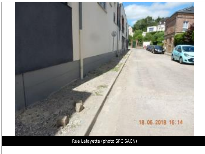
Rue Lafayette