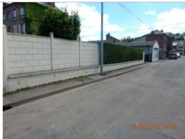
Rue Lafayette, à proximité du croisement avec la rue Traversière

Coordonnées WGS84 : X: 0.20004562 / Y: 48.92625500