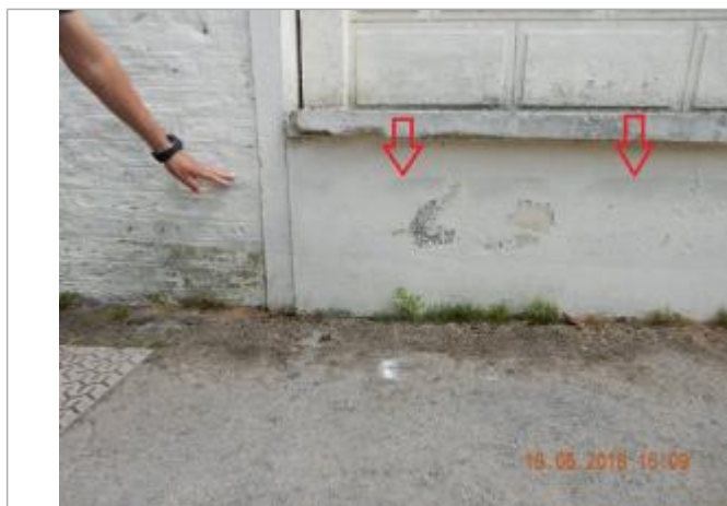
Traces laissées sur le mur

Altitude calculée de l'eau (en m) : 99.69 m