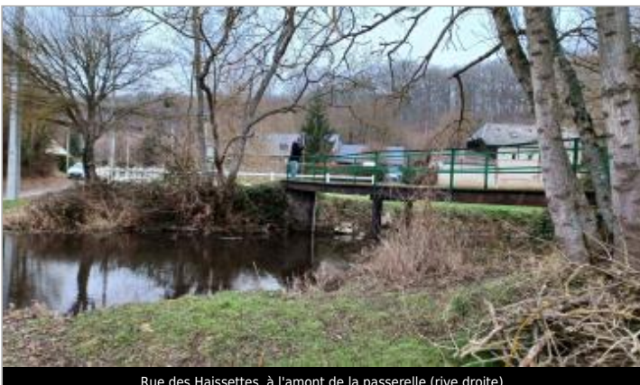
Rue des Haissettes, à l'amont de la passerelle (rive droite)

GÉOLOCALISATION Coordonnées WGS84 : X: 1.03833450 / Y: 48.96506400 Coordonnées RGF93 (Lambert 93) X: 556379.67 / Y: 6875685.61 Coordonnées RGF93 (ETRS89) : X: 1.0383345 / Y: 48.965064 Code Hydro: H43-0400 Rive de référence: Droite