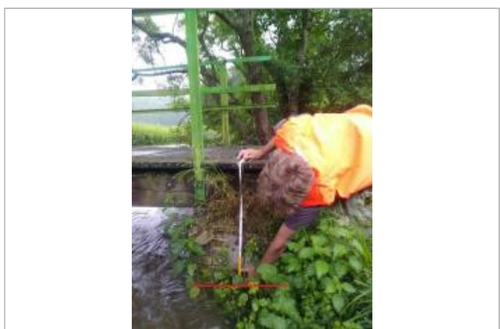
A l'amont de la passerelle, en rive droite

MARQUE Maximum de l'inondation : Oui Visibilité : Oui Repère calculé : Non Pérennité : Aucune PHEC : Non renseigné