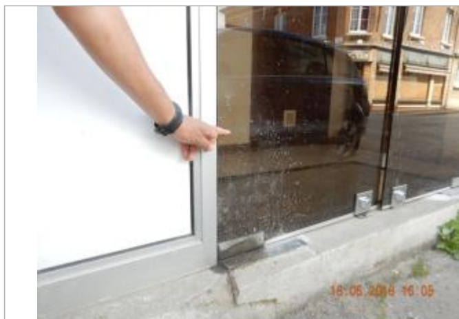
Traces laissées sur la porte vitrée

Altitude calculée de l'eau (en m) : 100.12 m