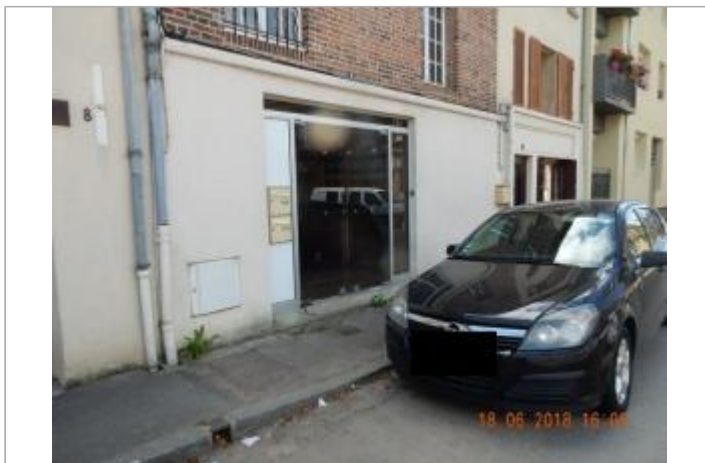
6 rue du Pont Vautier