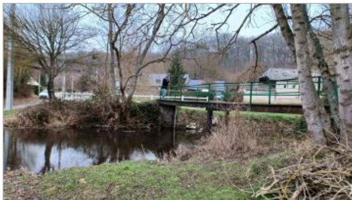
Rue des Haissettes, à l'amont de la passerelle (rive droite)