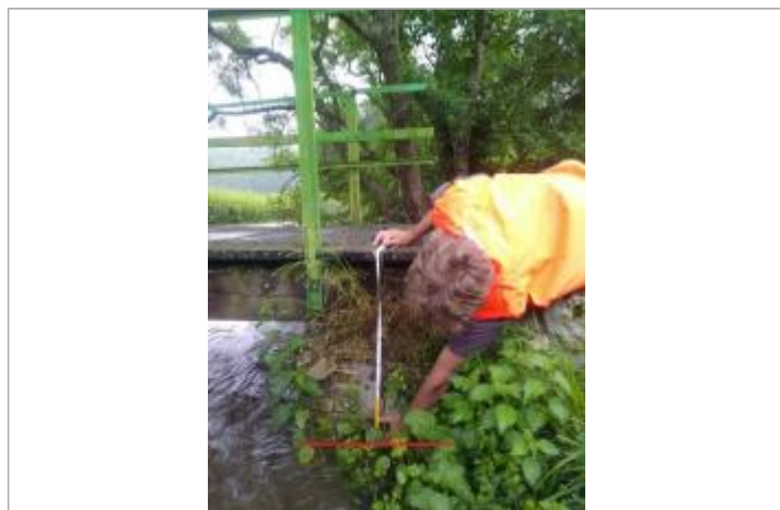
A l'amont de la passerelle, en rive droite

NIVELLEMENT SPC SACN. LE SPC N'EST PAS GÉOMÈTRE EXPERT, LES COTES SONT DONNÉES À TITRE INDICATIF. - 09/04/2025