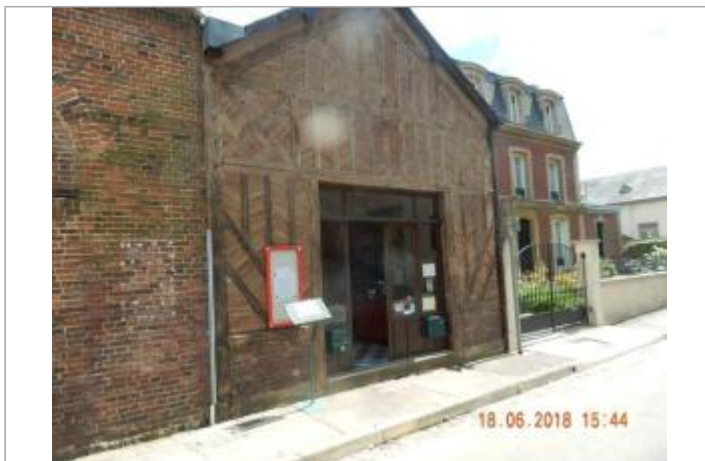
Avenue du Général de Gaulle, Musée du Camembert