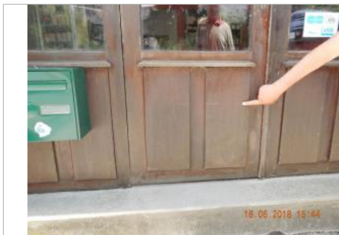
Traces laissées sur la porte d'entrée du Musée du Camembert

SOURCE DE REPÉRAGE : CAMPAGNE TERRAIN SPC SACN JUIN 2018 - 18/06/2018