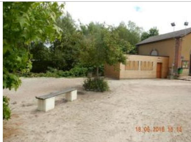
A l'aval du boulordrome