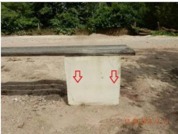
Traces laissées sur le banc le plus proches des bâtiments

Altitude calculée de l'eau (en m) : 96.26