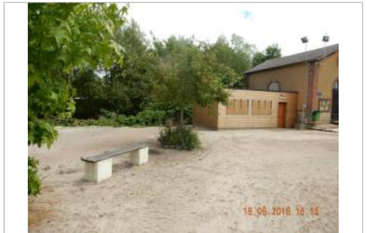
A l'aval du boulodrome

Coordonnées WGS84 : X: 0.19472798 / Y: 48.93233600