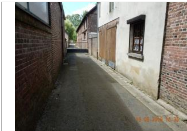
Portail de la maison familiale rurale