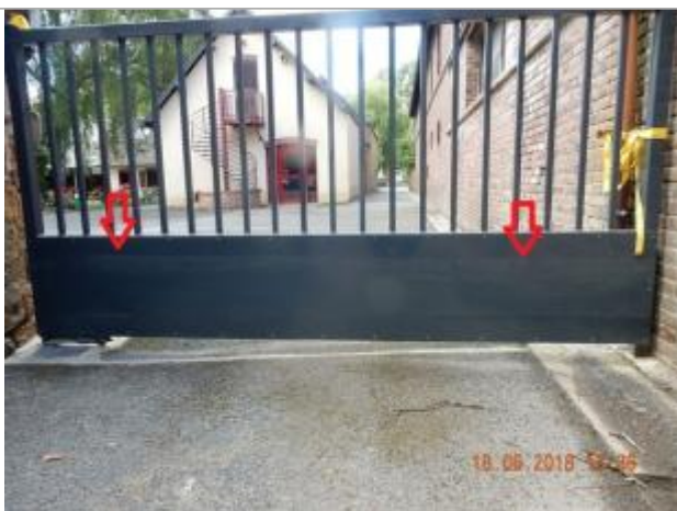
Traces sur le portail de la maison familiale

Altitude calculée de l'eau (en m) : 98.04 m