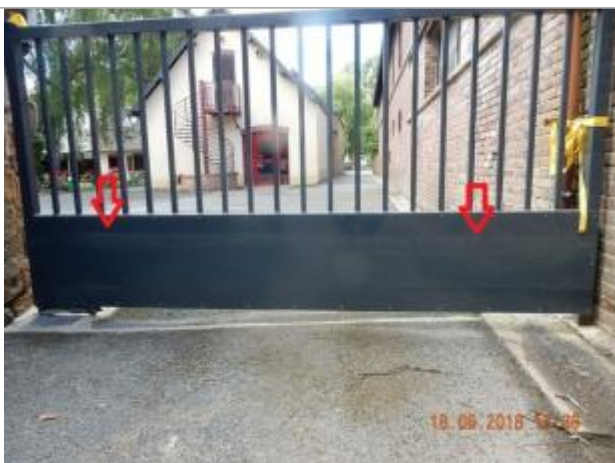
Traces sur le portail de la maison familiale

Altitude calculée de l'eau (en m) : 98.04 m