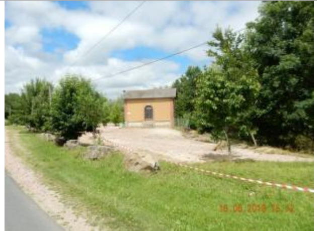
Le boulodrome à l'amont