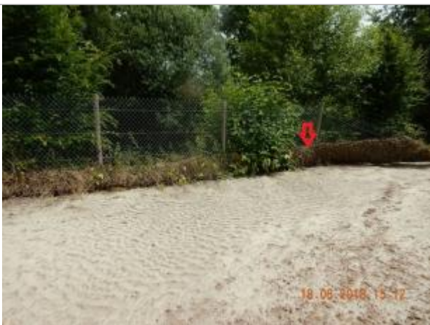
Dépôt de brindilles sur la clôture

Altitude calculée de l'eau (en m) : 96.68 m