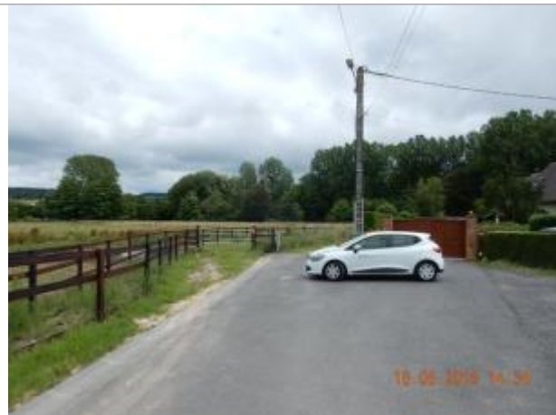
Le Pont, enclos du champ