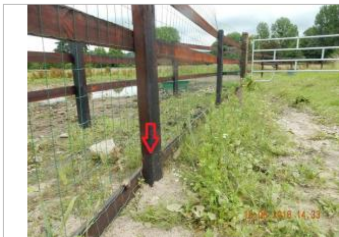
Dépot de brindilles sur le montant de l'enclos

SOURCE DE REPÉRAGE : CAMPAGNE TERRAIN SPC SACN JUIN 2018 - 18/06/2018