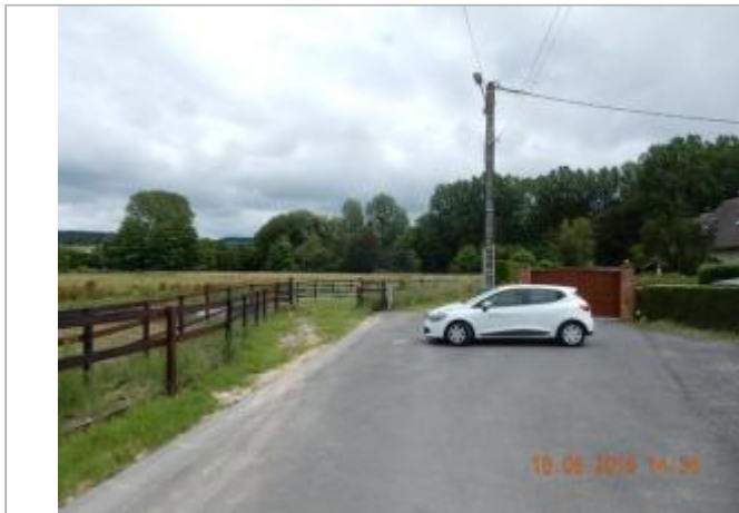
Le Pont, enclos du champ