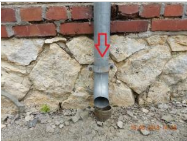
Dépôt de brindilles sur la gouttière

Altitude calculée de l'eau (en m) : 61.205 m