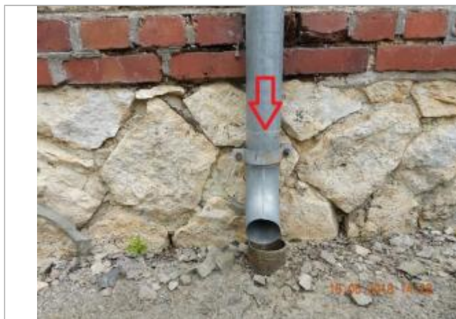
Dépôt de brindilles sur la gouttière

Altitude calculée de l'eau (en m) : 61.205 m