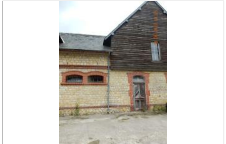
Façade ouest du bâtiment à proximité du pont sur la Vie

Code Hydro : I13-0400 Rive de référence : Droite