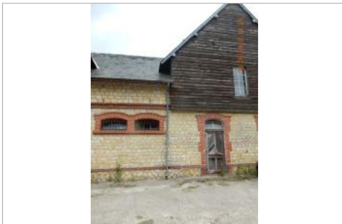
Façade ouest du bâtiment à proximité du pont sur la Vie