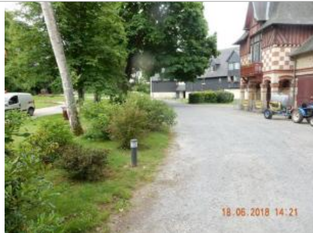
A proximité de la fontaine, sur l'éclairage au sol