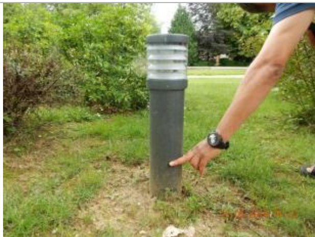
Dépôt de brindilles sur l'éclairage au sol