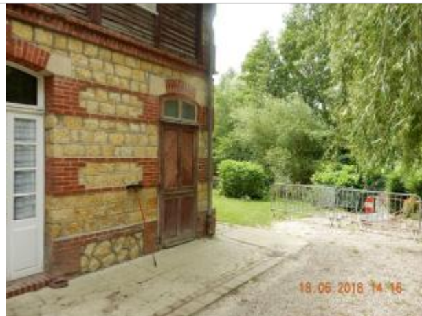
Bâtiment à proximité de la passerelle sur la Vie