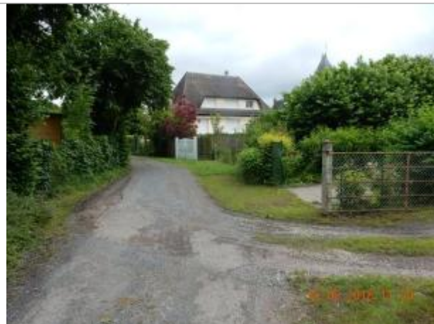
Au niveau du portail blanc, rue de la Fontaine Isabeau