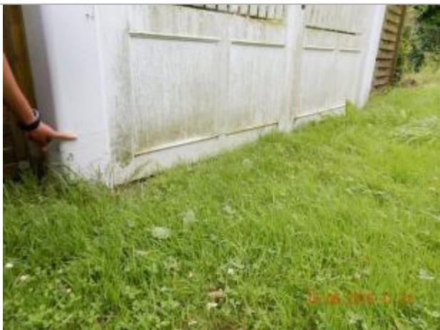
Dépôt de brindilles sur le portail

Organisme : SPC Seine aval - Côtiers normands