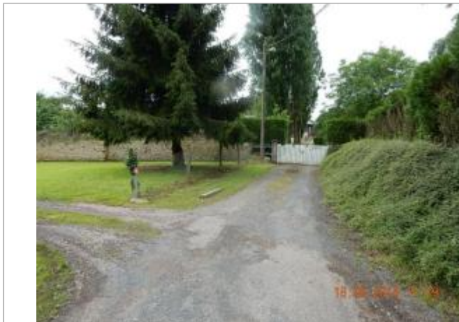
Au bout de la rue de la Fontaine Isabeau