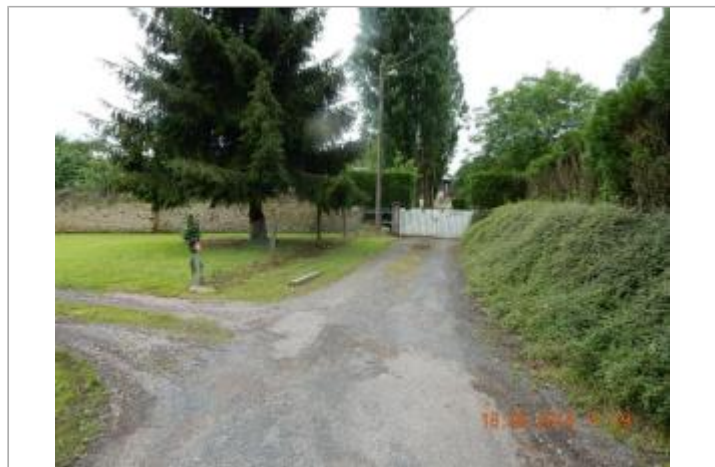
Au bout de la rue de la Fontaine Isabeau

GÉOLOCALISATION Coordonnées WGS84 : X: -0.12759850 / Y: 48.71675300 Coordonnées RGF93 (Lambert 93) X: 469960.66 / Y: 6850847.33 Coordonnées RGF93 (ETRS89) : X: -0.1275985 / Y: 48.716753 Code Hydro: I21-0410 Rive de référence: Droite