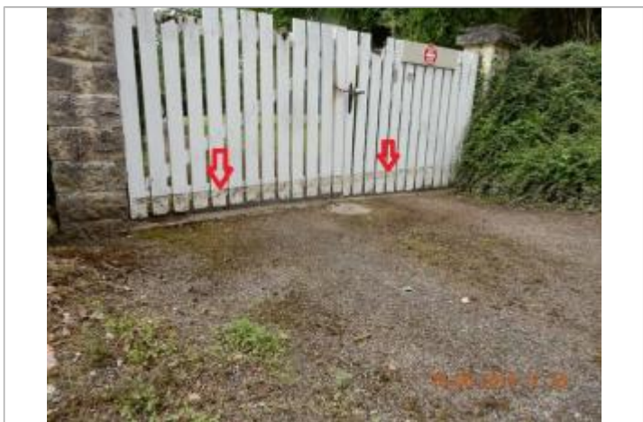
Dépot de brindilles sur le portail

MARQUE Maximum de l'inondation : Oui Visibilité : Oui Repère calculé : Non Pérennité : Aucune PHEC : Non