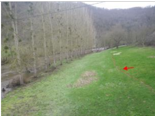
Vue de la laisse d'inondation