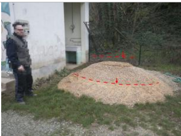
Vue de la laisse d'inondation - Auteur : AGERIN

Différence entre le niveau d'eau et la référence (en m) : 0.410 m