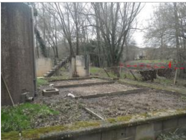
Vue de la laisse d'inondation - Auteur : AGERIN