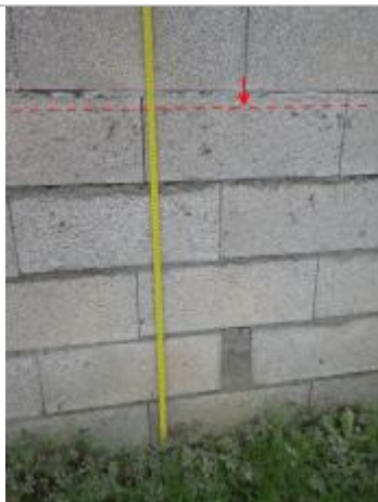
Vue de la laisse d'inondation - Auteur : AGERIN