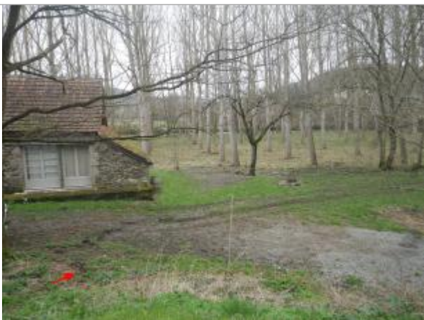
Vue de la laisse d'inondation